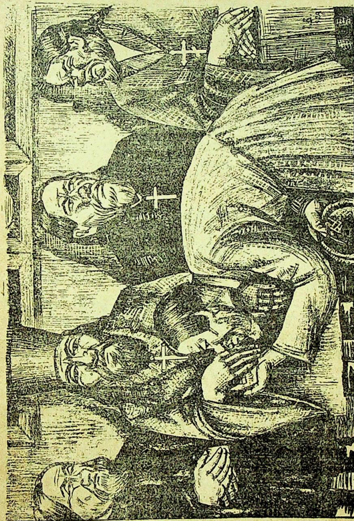
— Спаси вас господи!—і нахилився під благословення. Благочинний помахав, помахав рукою, потім сунув нею в ніс